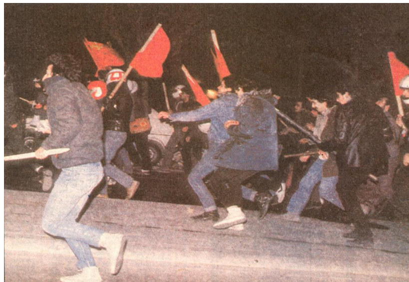
Auch die Juristische Fakultät Nomiki war 1985 Ziel von Angriffen der Bullen

Die Ausländer sind die falsche Adresse haut den Politikern auf die Fresse tönt es, nachdem einhundert Menschen nur mit Glück knapp dem ihnen vom Mob zugedachten Flammentod entkommen sind. Sie hatten während der Tage des Pogroms komplett versagt und nun wurden an den Mob pädagogisch aufklärerische Ansprachen gehalten?