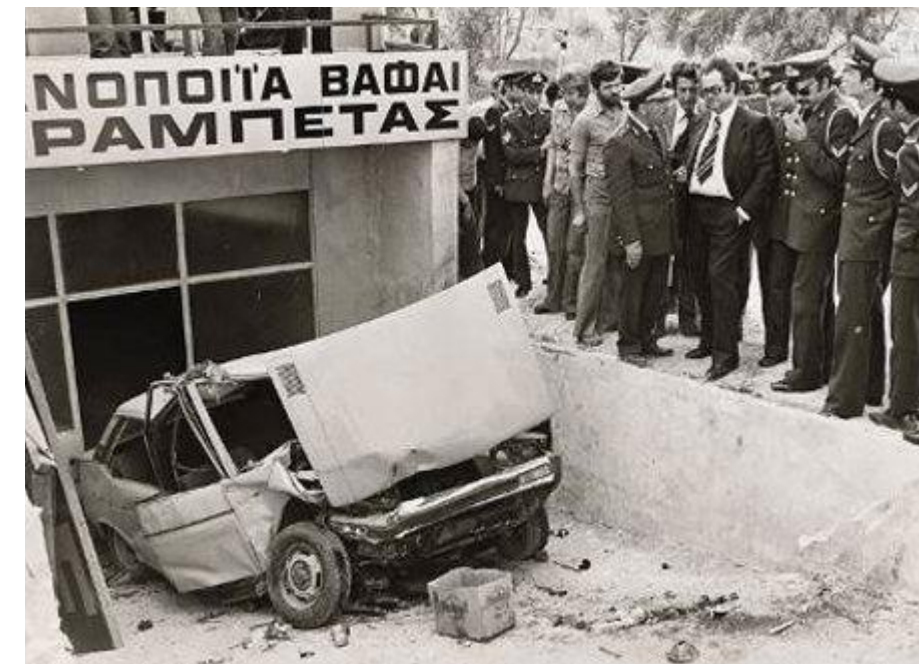
Das von Killern gerammte Auto von Alekos Panagoulis

Einen Tag später wurde Alekos Panagoulis von Elementen des „tiefen Staates“ in einem fingierten Verkehrsunfall ermordet, kurz bevor er verschollene Dokumente der ESA (Militärpolizei) veröffentlichen konnte, die eine Verwicklung von demokratischen Politikern in Verbrechen der Junta bewiesen hätten.