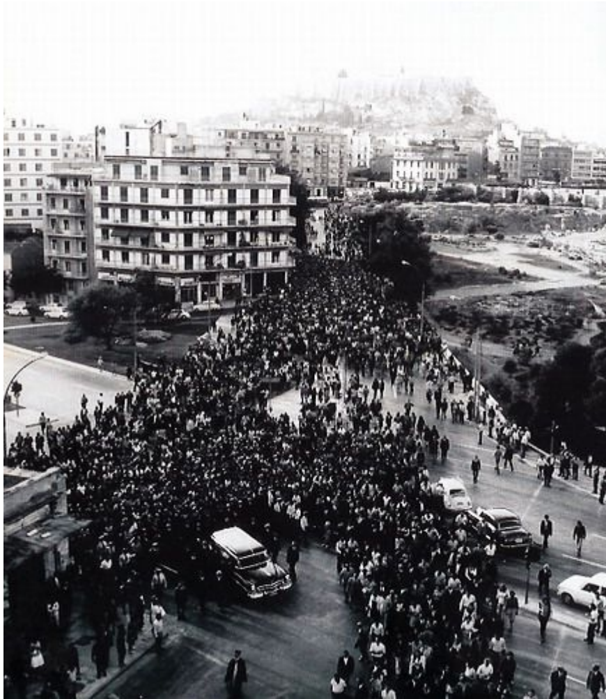
Zum fünften Jahrestag des Putsches sprengt LEA am 19. April 1972 in Piräus eine Statue von General Metaxas, dem Diktator von 1936 – 41. In

einer international organisierten Elite mit ihren Netzwerken der Unterdrückung und Ausbeutung gegenüberstehen.