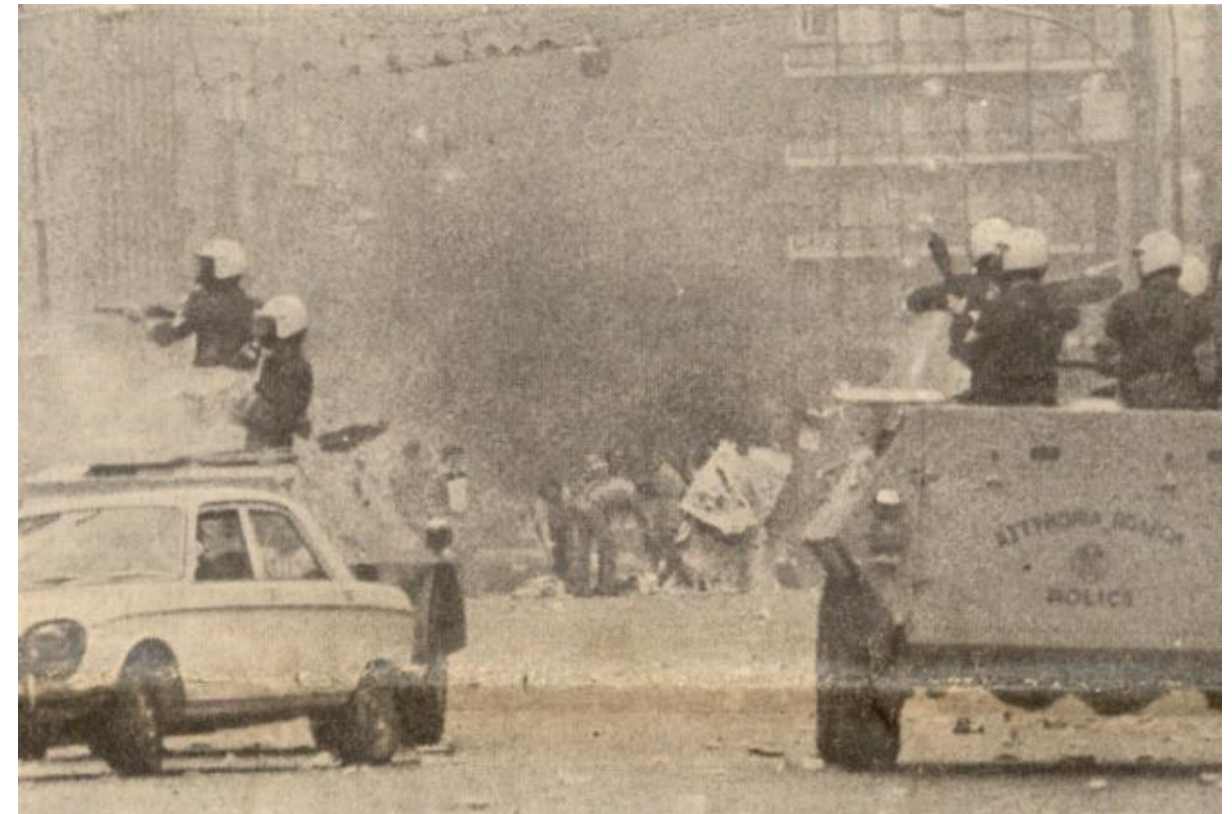
Panzereinsatz am 25. Mai 1976

Helge: Ja, das war eine krasse Nummer und hat damals nicht nur richtig viel kaputt gemacht, sondern war auch sozusagen so ein Moment, genauso wie B'Null, Spaltungen, das ist in der gleichen Zeit. Natürlich gab es in der Zeit endlose Militanzdiskussionen, völlig neben der Rolle, völlig entglitten, ohne jede Substanz. Alle hatten Schiss, dass sie abgehört wurden und alle ständig kontrolliert werden